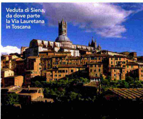
Veduta di Siena, da dove parte la Via Lauretana in Toscana

Passo dopo passo ci si può avventurare in una terra che sa regalare bellezze naturali e paesaggi straordinari e che è un patrimonio di borghi raccolti e grandi città d'arte. Una maniera antica, ma anche la più moderna, personale e sostenibile per apprezzarne i tanti tesori